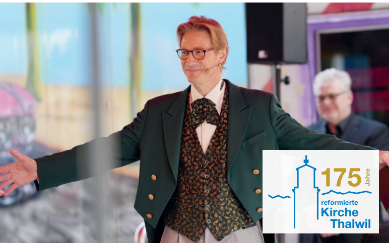
(oben) Chilbigottesdienst: Auftakt 175 Jahre reformierte Kirche Thalwil (unten) H2OT-Taufgottesdienst am See