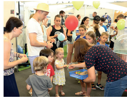
Kinder und Jugendliche erfreuten sich am Büchschenschiessen und die Erwachsenen frequentierten die Anlaufstelle für Hoffnung. Kostenlose «Hoffnungslose» gab es für alle.

Im Jahr 2022 atmete auch unsere Kirchgemeinde nach der langen Zeit der pandemiebedingten Einschränkungen wieder auf. Schnell knüpften wir wieder Kontakte und nutzen die «Hoffnungsfunken» alter und neuer Gefässe, in denen wir Gemeinschaft pflegten. Gleichwohl liessen sich die Spuren der Isolierung, gerade auch bei Kindern und Jugendlichen, bis in unsere Gemeinde hinein verfolgen. Dabei stellte sich die Frage, ob wir für heftig und spontan auftauchende Lebensfragen stets die richtige Begleitung haben anbieten können. Herausfordernd war es, wenn die Anfragen an uns als «letzte Chance» verstanden und nichts weniger als Wunder erwartet wurden.