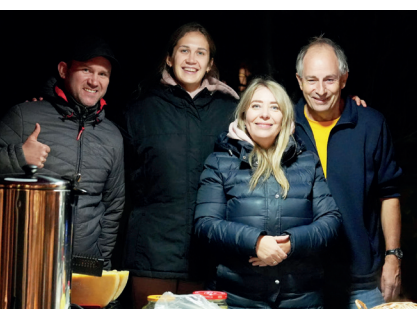
Stellvertretend für die 200 freiwillig Engagierten: Jugendtageslager und Ukrainerinnen und Ukrainer am Adventsmarkt