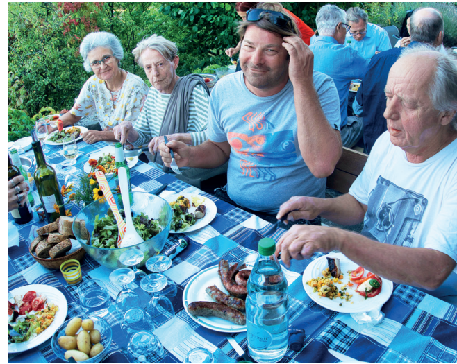
(links) Martinifest mit stimmungsvollem Laternenumzug und Guggenmusik