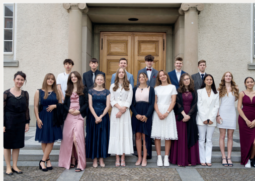
Konfirmation 22. Mai 2022