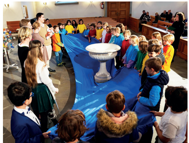
(oben) Taufgottesdienst mit den 3. Klass-Uni-Kindern (unten) Gottesdienst im Alterszentrum Serata

Die Gottesdienste nahmen in diesem Jahr an Fahrt auf und an Farben zu. Neu darunter der Schnitzelbankgottesdienst zur Fastenzeit, dessen Texte von der Begrüssung bis zum Segen in Reimen gestaltet waren. Ebenfalls mit einem neuen Akzent versehen, gestalteten sich die ersten als «FamilienKirche» bezeichneten Feiern, interaktiv und generationenverbindend. Bei den Feiern, die die Kirche zum Begegnungsort unter der Woche werden lassen, bewährte sich das «Innehalten um 12» als eine Form, die sich in der Kampagnenzeit von HEKS bedürfnisgerecht als ökumenisches Fastenessen gestalten liess.