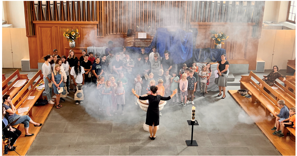
(unten) Kinder- und Jugendtageslager in Thalwil während der Sommerferien