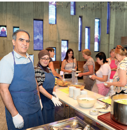
Encontro-Mittagessen im Sommer