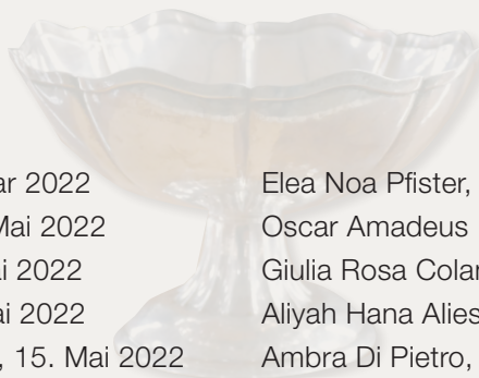
Konfirmation 15. Mai 2022