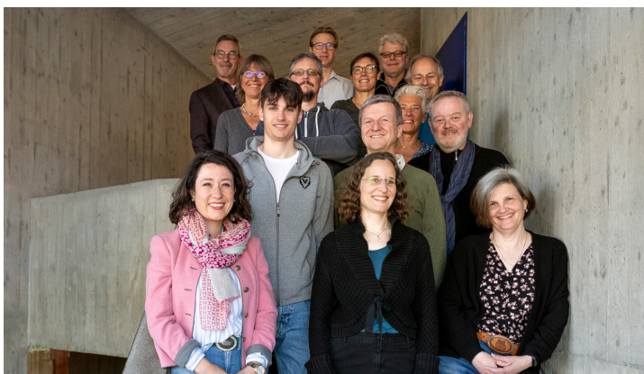
Unsere Mitarbeitenden 2021/22