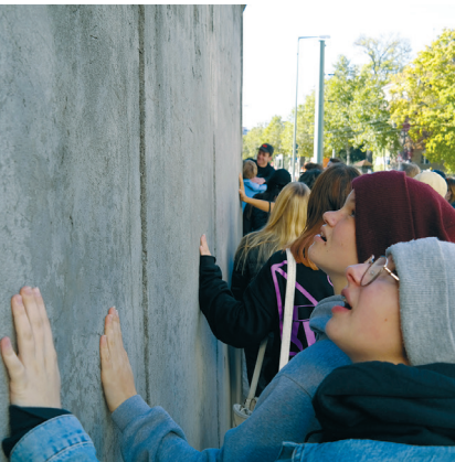
Geschichte zum Anfassen: Jugendliche an der Berliner Mauer