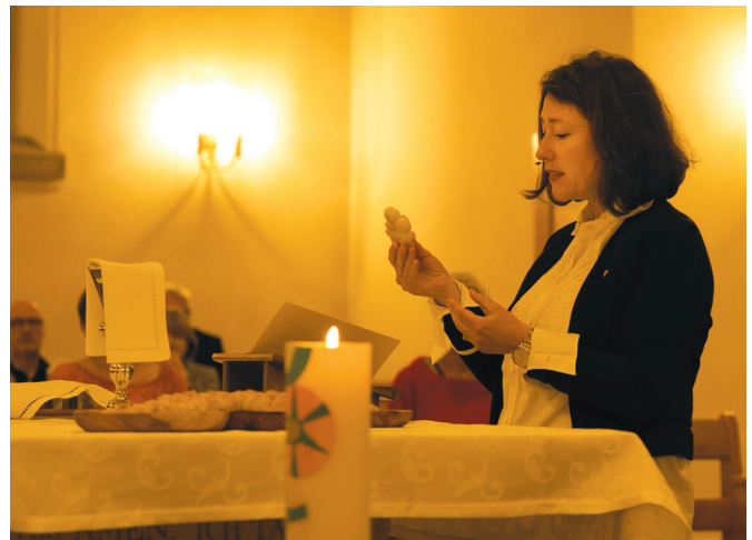
3. Klass-Gottesdienst: Zum ersten Mal das Abendmahl feiern.