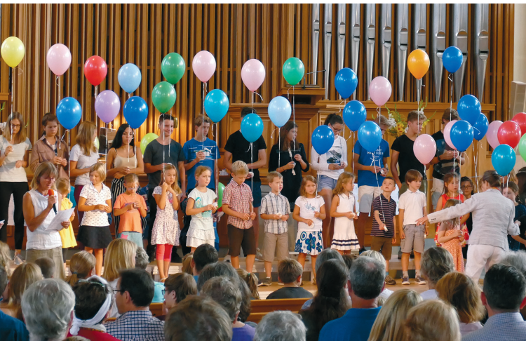
Schulanfangsgottesdienst: Kunterbunter Start ins Schuljahr 2021/22