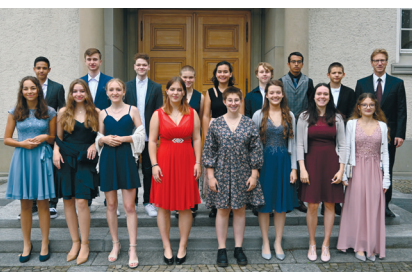
Konfirmation vom 12. September 2021