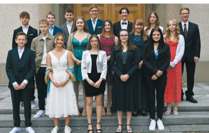
Konfirmation vom 29. August 2021