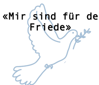
Mit Frieden setzten sich die Jugendlichen im «Lighthouse» Gottesdienst auseinander.