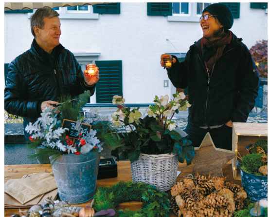
Adventsstimmung rund um die Kirche