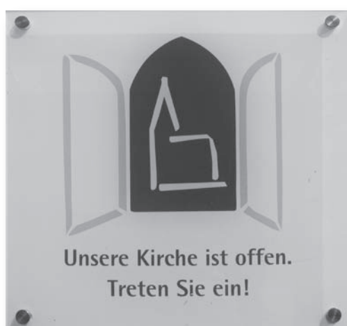
«Offene Kirche» für alle

«Die Kirche ist für mich das Haus Gottes, und das ist auch mein Haus. Ich kann da jederzeit hinein gehen. Ich kann mich sogar in die Kirche flüchten. Dort ist ein Platz für alle, und dort wird ihnen auch Schutz gewährt. Und dort fühl ich mich auch sehr zu Hause, muss ich sagen, vor allen Dingen, wenn ich ganz alleine bin.»